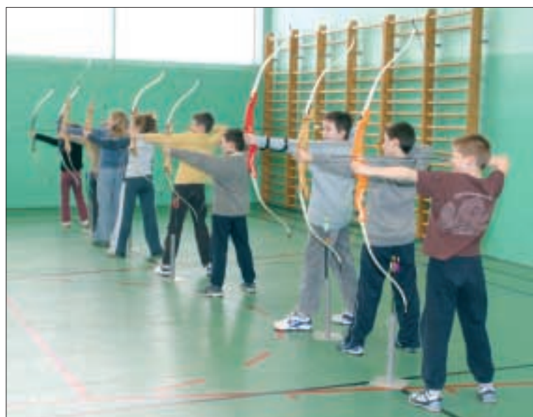
Grâce aux stages de découverte sportive de la mairie, près de quatre-vingts enfants saint-germainois ont pu s'initier au tir à l'arc pendant les vacances scolaires de février.

Et les champions de demain figurent peut-être parmi les Saint-Germainois inscrits au stage de découverte sportive.